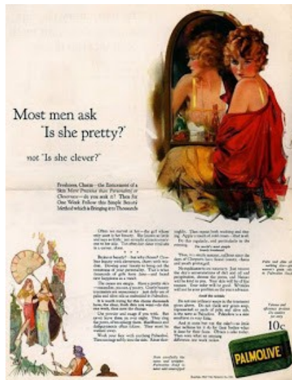
"Les hommes disent : Est-elle jolie ? Et non : Est-elle intelligente ?" Palmolive