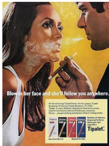
"Souffle sur son visage et elle te suivra partout" publicite pour une marque de cigarette